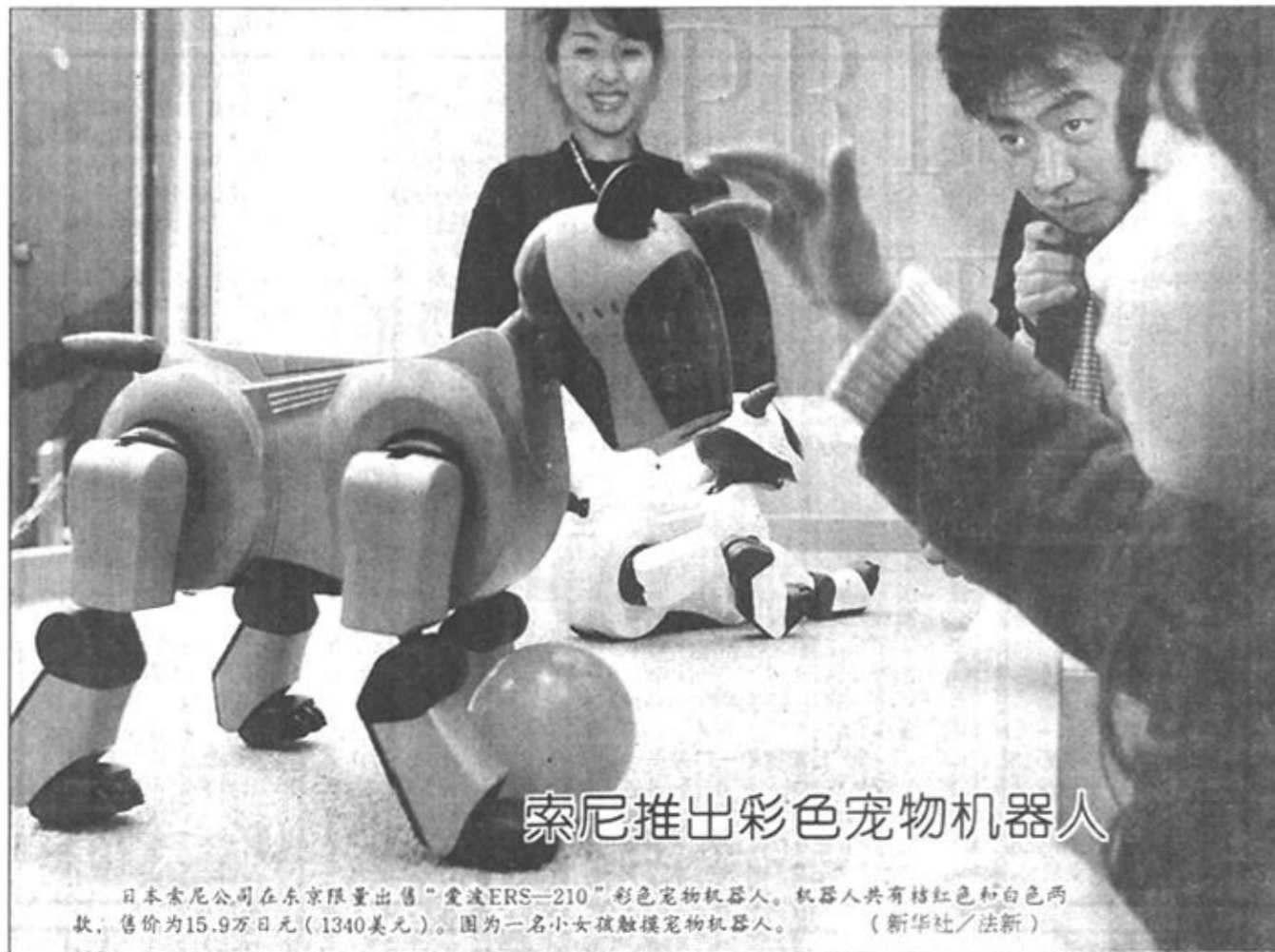
索尼推出彩色宠物机器人

研究人员指出，人类大脑中的海马区在学习和记忆过程中担当着重要作用，其中的神经细胞要恢复机能需要一段时间，这段恢复时间随年龄的增加而增长。基因突变的结果缩短了这段恢复时间，从而可减缓记忆力丧失的过程。