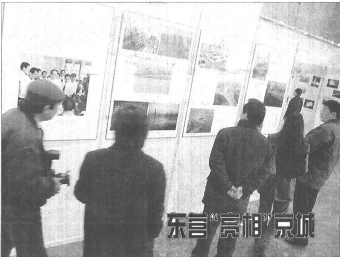
由人民日报市场信息中心举办的“中国新兴城市文化形象摄影展”于3月5日在中国历史博物馆展出。40余家城市展出了近500余幅作品，反映了参展城市的精神风貌、改革成就、人文环境、地域文化及城市建设风采等。我市作为新兴城市参展，吸引着首都观众驻足观看。

唱响主旋律，打好主动仗，必须进一步转变工作作风，改进文风，使我们所宣传的内容，符合社会实际，符合群众需要，不断增强吸引力和感染力，不断提高引导水平。具体地说，要提高工作质量和水平，必须在求实、求深、求新上下功夫。求“深”，就是深入群众，深入实际，把工作做深，把道理讲透。求“实”，要重点抓好两个环节：始终服从服务于经济建设这个中心；虚心务实，务求实效。求“新”，就是要勇于开拓创新。只有认真研究新形势下党的宣传思想工作的规律和特点，积极探索新办法、新机制，才能更加有效地发挥团结人、教育人、引导人、鼓舞人的作用。