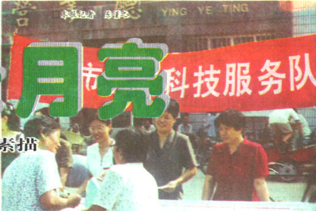
东营市农业科技服务队成员在田间指导农户进行农业生产。

有人说，女人是靠自己才能发光的月亮。但是，当你知道了这些巾帼致富能手的创业史之后，你会感觉到女人决不是月亮，女人是自己能发光发热的太阳。