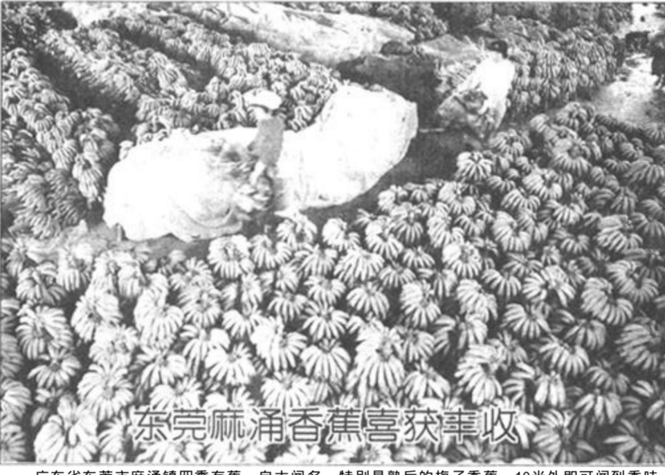
东莞麻涌香蕉喜获丰收

恢复和发展同原苏联在亚洲的一些盟国的关系，并广泛参与亚太地区事务，是俄罗斯积极发展同亚洲国家关系的另一个重要原因。普京担任总统以来已先后实现了俄总统对朝鲜、蒙古和越南的首次访问。普京访问这些国家旨在恢复俄在原苏联盟国中的影响以及传统的政治和经贸合作关系。普京访越促进了俄越新型政治关系的发展。访问期间，双方签署了战略伙伴关系宣言，表示将在21世纪继续进一步巩固传统友好关系，并加强在防务等方面的合作。 俄罗斯积极发展同朝鲜和韩国的关系，表明俄正努力在朝鲜半岛事务中发挥更加积极的作用。普京在韩国表示，俄将继续支持韩朝关