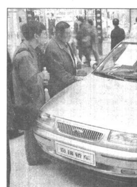
一批款式新颖、性能优异、价格低廉的国产经济型轿车近日在北京新东安市场与大众见面,吸引了众多国人的目光。这是上汽集团奇瑞汽车有限公司生产的一款“奇瑞”牌家用经济型轿车。该车车身长4.32米,宽1.68米,高1.42米,使用排量为1.6升的电喷发动机,最高时速可达168公里/小时,百公里等速油耗7升,加三元催化装置后,排放达到欧洲二号标准。其标准型车售价在10万元以内。

今年政协委员通过网络向大会提案组递交提案15件,大会提案组还将九三学社提交的《关于科研院所转制的若干建议》等3份提案的内容通过互联网向社会公布。