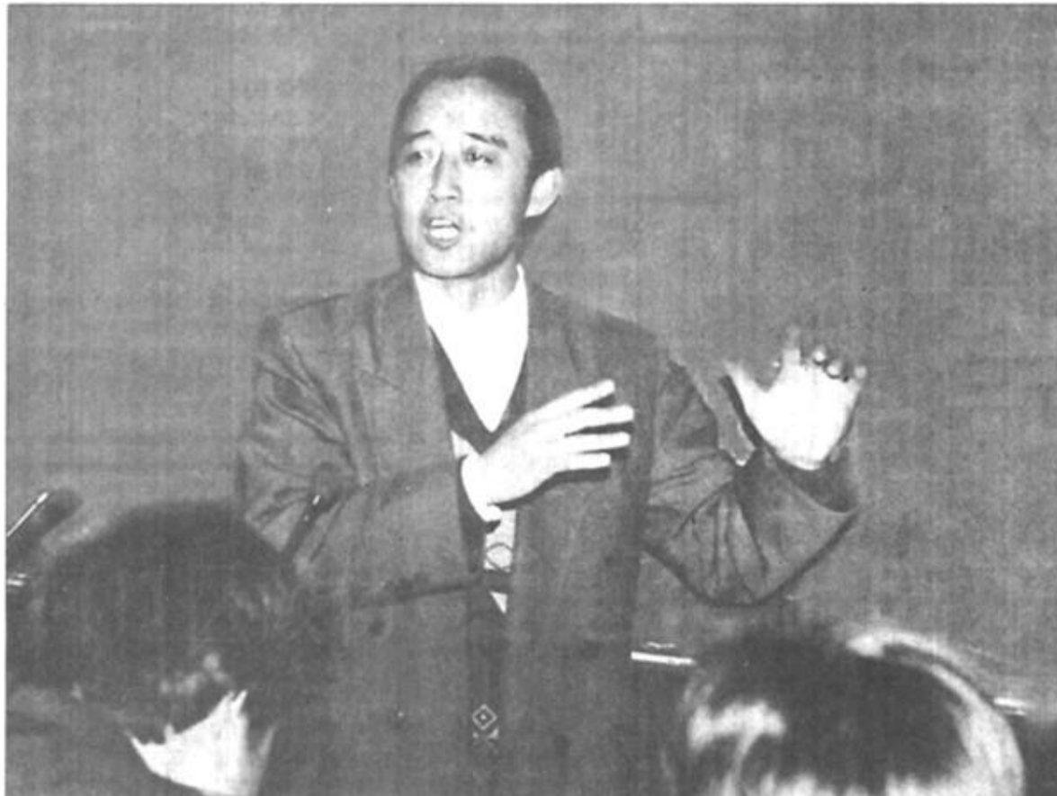
胜利石油管理局工程建设三公司第一工程处党委和行政领导班子，携手并肩、同心协力，坚持精神文明和物质文明一起抓，取得了两个文明建设双丰收。精神文明方面，先后荣获胜利石油管理局“先进基层党组织”、“局”“双文明先进单位”、“局”“综合治理模范单位”等荣誉称号。物质文明方面，施工产值创出历史新高，去年完成1.39亿元；内部利润超额完成对上承包指标，走在了公司各单位的前列；其他经济技术指标也都圆满完成。

最大限度地防范不廉洁问题的发生，提高税务稽查的质量和水平将起到积极的促进作用。（李子征 刘工农） 组稿编辑 王海林 版式设计 赵玉武 本版校对 刘铭芬