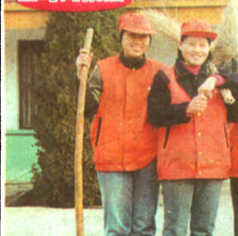
公路局女子道班的五名姐妹用勤劳的双手和智慧在公路建设中展示女性风采。